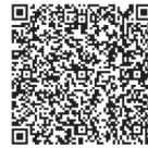
▲公園釣り場ガイド (埼玉県版)

〒361-0053 埼玉県行田市水城公園1249 TEL.048-556-1111 (行田市都市計画課)